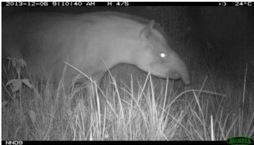
Een camera registratie van een Laagland tapir in Trésor.

van jacht, zowel binnen als buiten het reservaat, van de juiste gegevens te voorzien. De resultaten van dit onderzoek zullen naar verwachting in 2015 worden gepubliceerd.